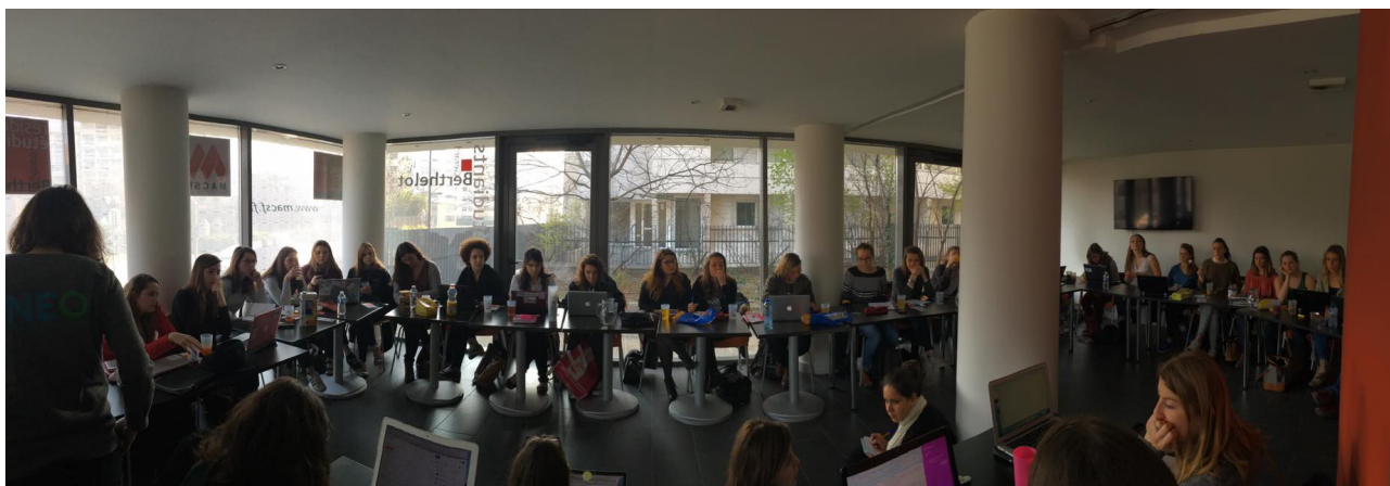
Le conseil d'administration de la FNEO

En 2012, un poste de Vice-Président en charge des questions sociales a été créé au sein du bureau national de la FNEO. Nous mettons à disposition des étudiants des informations sur leurs droits, notamment par le biais d'un guide des aides sociales. Des enquêtes ont permis d'évaluer le coût des études et d'apprécier l'accès au soin des étudiants en orthophonie. Cette année nous avons quantifié les frais occasionnés par les stages. Nous souhaitons donc vous sensibiliser à ces problématiques.